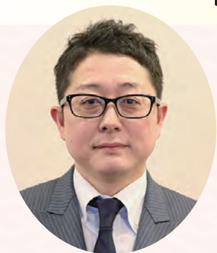
弘前商工会議所青年部 令和5・6年度会長